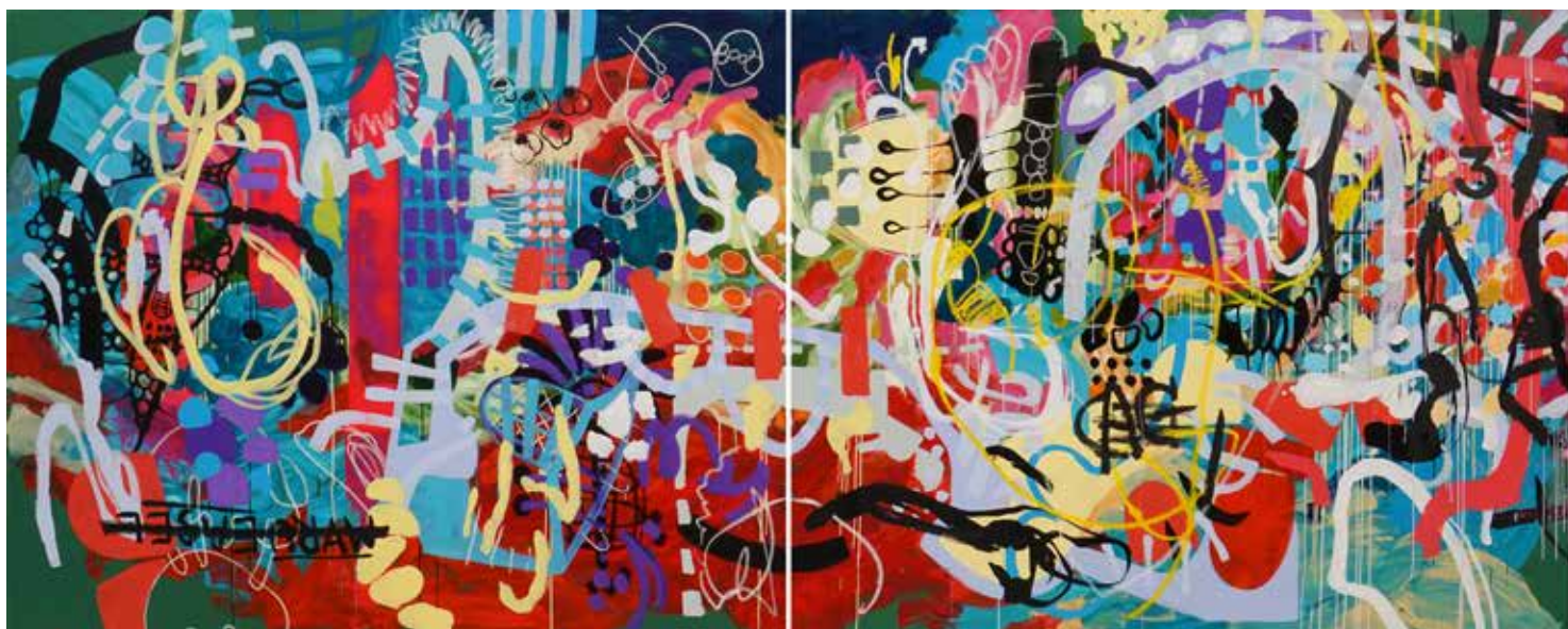
Kemalezidine, Dance Macabre, 2018, Acrylic and oil bar on canvas, 200 x 1000 cm (tetraptych)