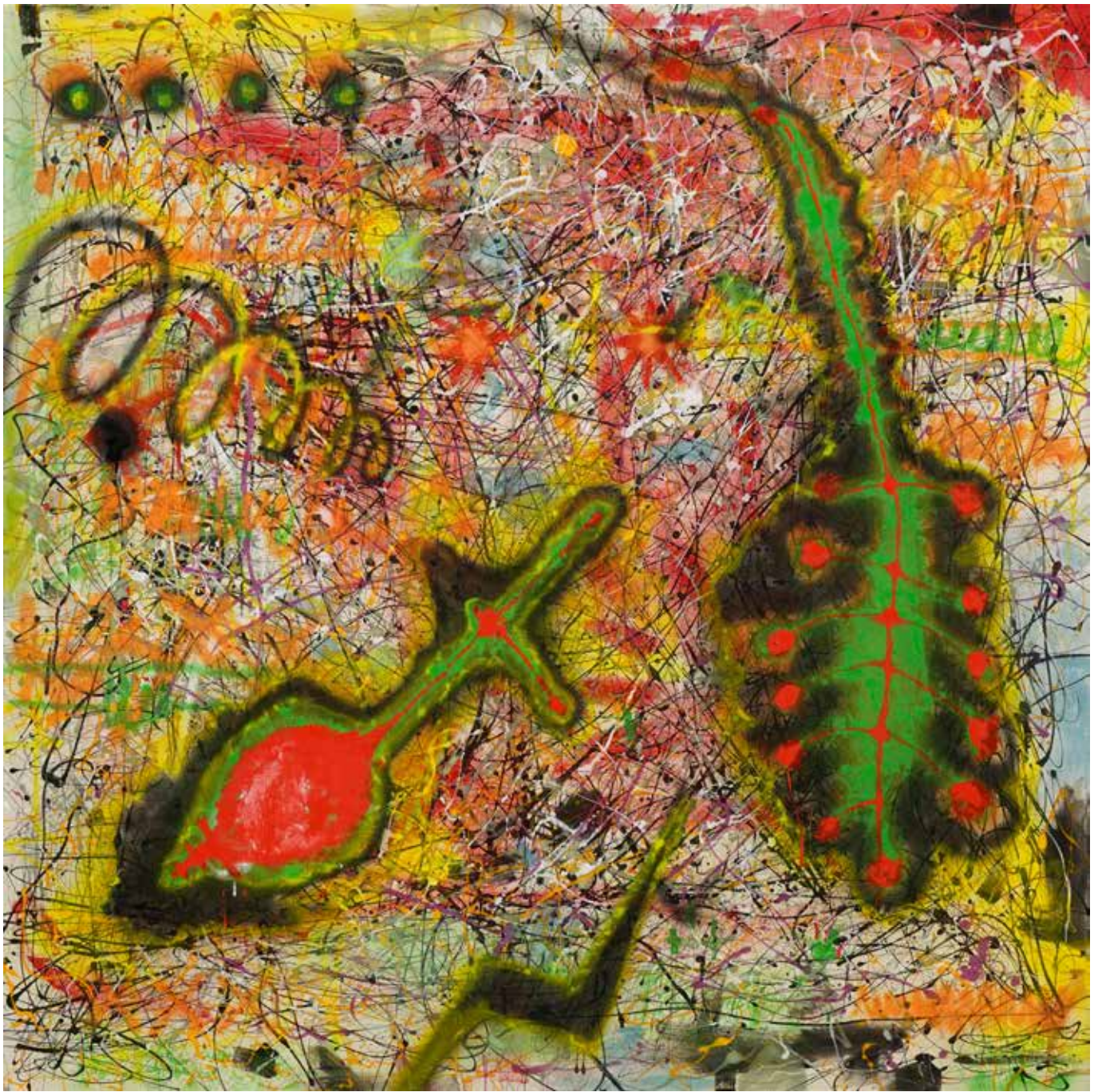
Ketut Moniarta, Me Us Pollock, 2018, Enamel on canvas, 200 x 200 cm.