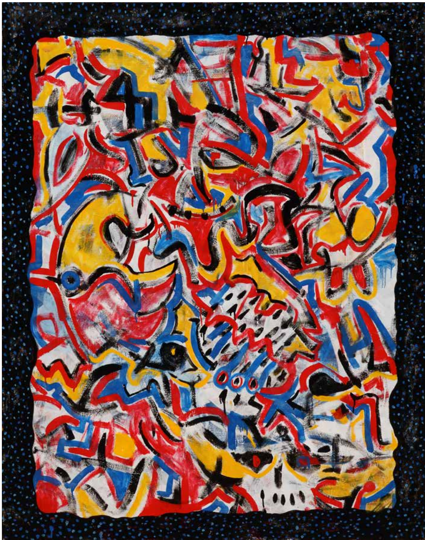
Ketut Moniarta, Terminator, 2018, Enamel on canvas, 179 x 140 cm.