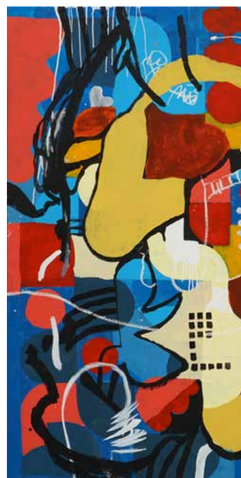
Kemalezidine, Untitled no. 13, 2018, Acrylic on canvas, 200 x 200 cm.