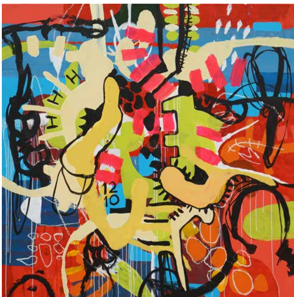
Kemalezidine, Square Hammer #1, 2018, Acrylic on canvas, 200 x 200 cm.