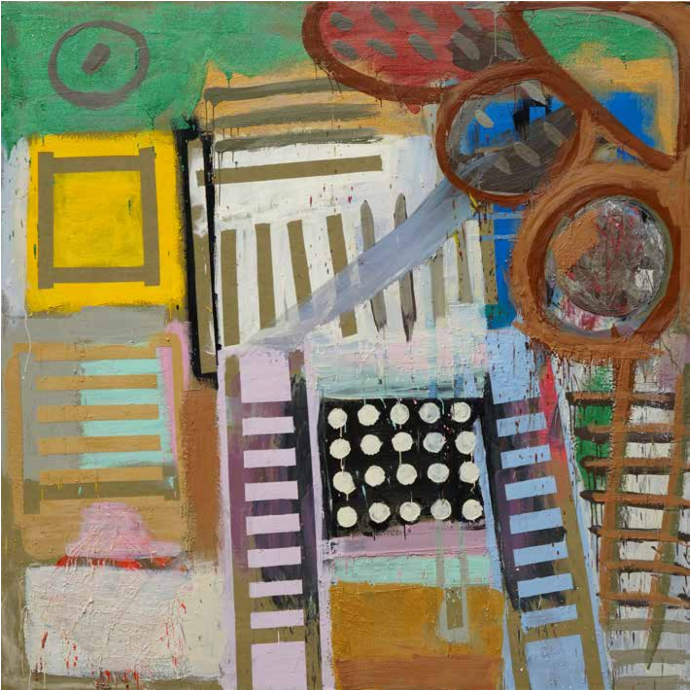
Gede Mahendra Yasa, Untitled #2, 2018, Encaustic on linen, 200 x 200 cm.