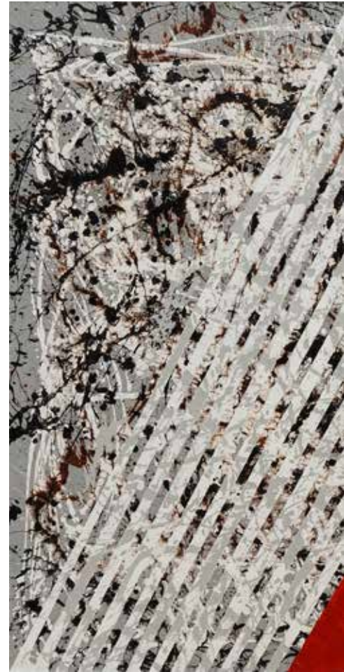
I Putu Bonuz Sudiana, Fire, 2018, Acrylic on canvas, 150 x 150 cm.