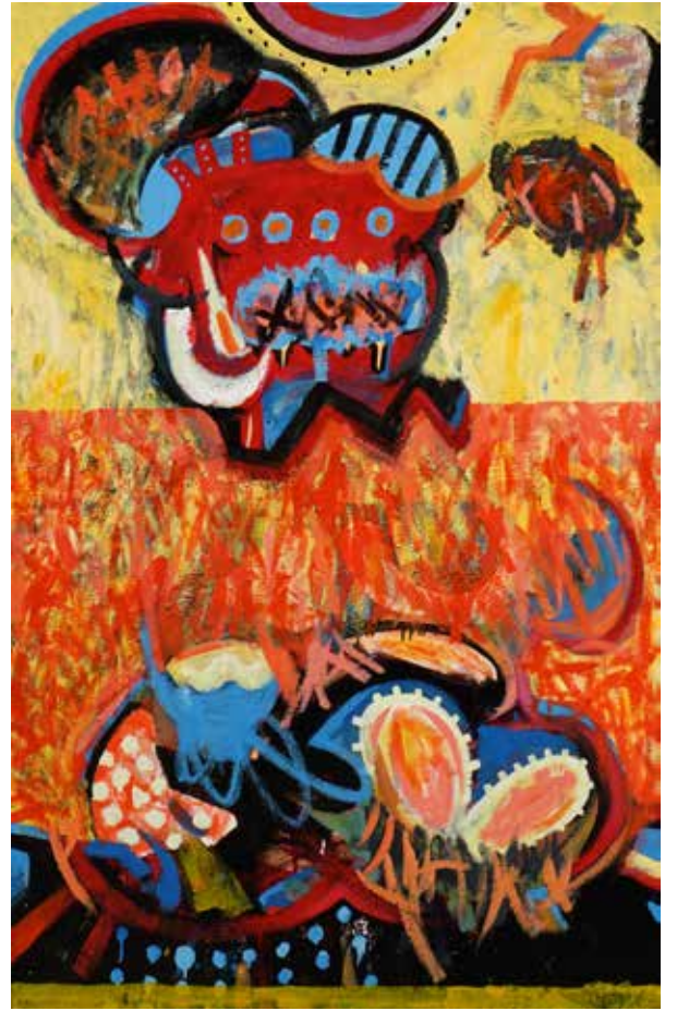
Ketut Moniarta, Love Flower, 2018, Enamel on canvas, 179 x 139 cm.