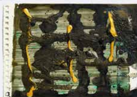
Dewa Ngakan Made Ardana, Mata Mendengar #18 -30, 2018, Acrylic, gouache and glue on paper, 14.7 x 20.9 cm/20.9 x 14.7 cm (each)