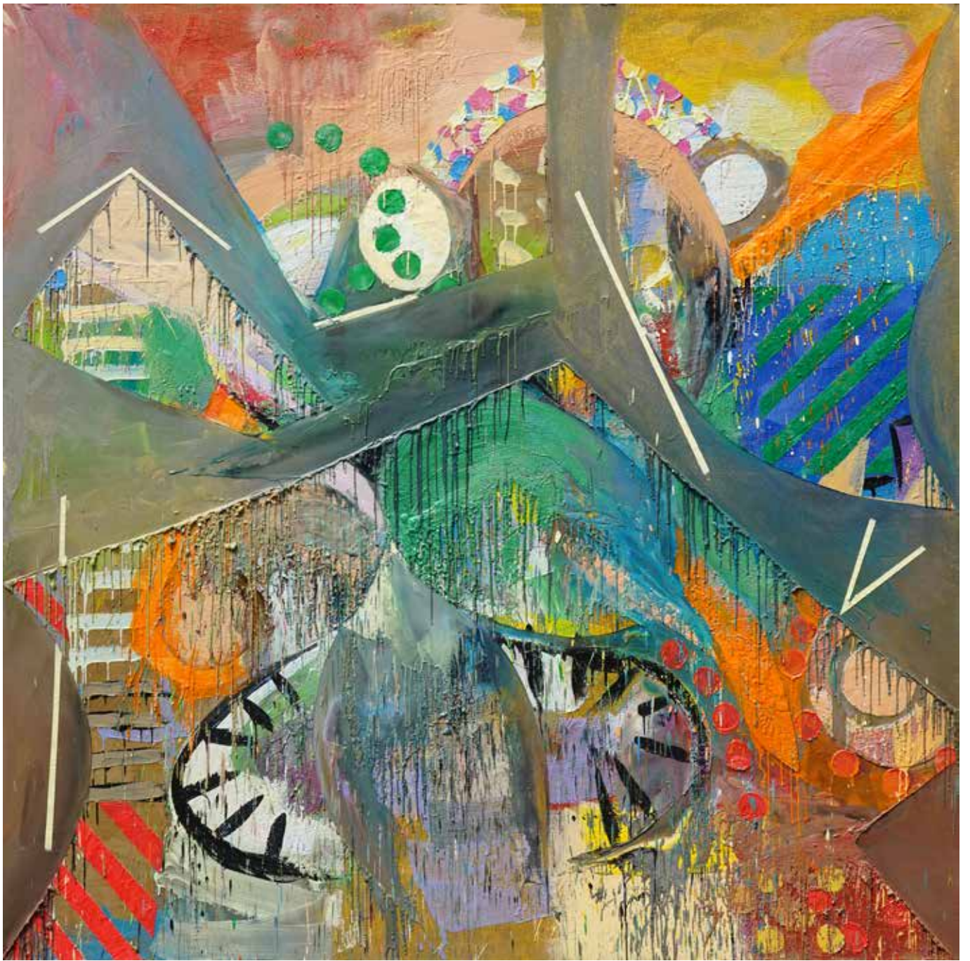
Gede Mahendra Yasa, Untitled #4, 2018, Encaustic on linen, 200 x 200 cm.