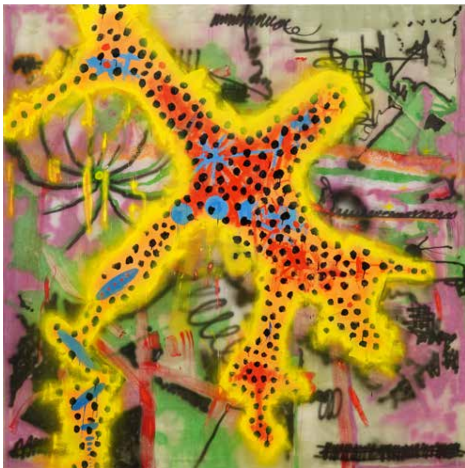
Ketut Moniarta Natural Mystic 2018 Enamel on canvas 200 x 200 cm.